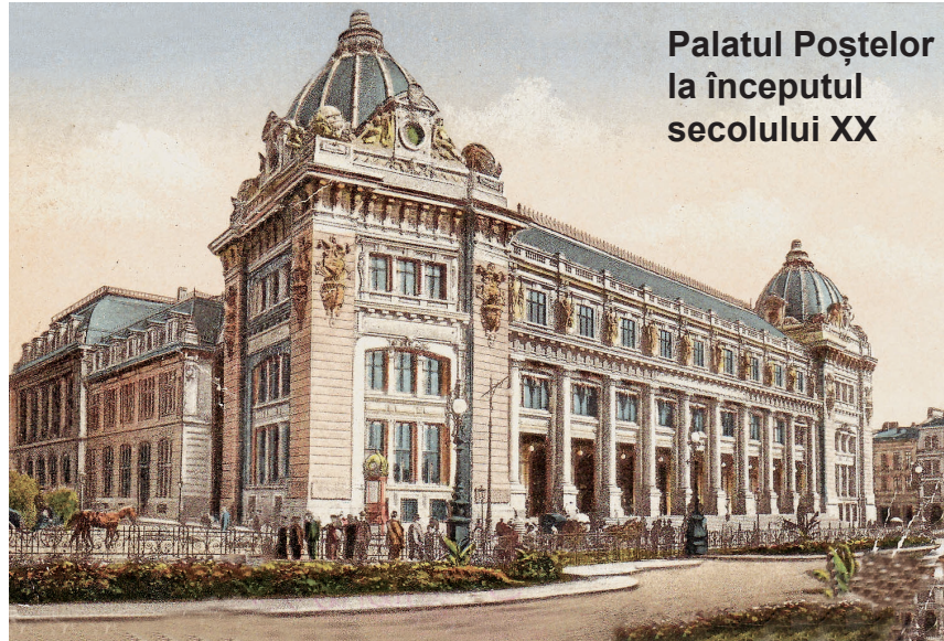
Palatul Poștelor la începutul secolului XX