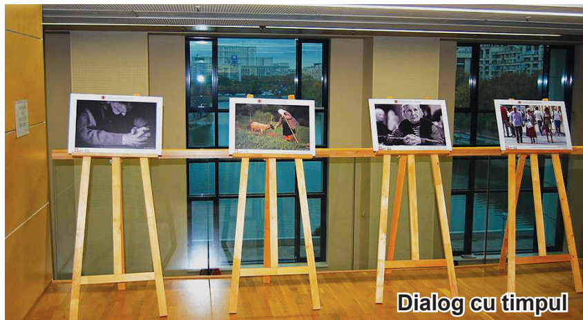
Dialog cu timpul

Organizată de Confederația Caritas România, în parteneriat cu Asociația C.A.R.P. „OMENIA” București în cadrul proiectului „Cetățeni Activi la Puterea a Treia”, expoziția cuprinde 20 de fotografii emoționante care surprind ipostazele diverse ale vieții la vârsta a treia: „Această expoziție prezintă o imagine de ansamblu asupra vieții vârstnicilor din toată România, atât din mediul urban, cât și din cel rural. Imaginile impresionante prezintă dreptul la o bătrânețe demnă și activă prin exemple pozitive, însă fără a neglija și situația dramatică în care milioane de vârstnici se află în România, o realitate a