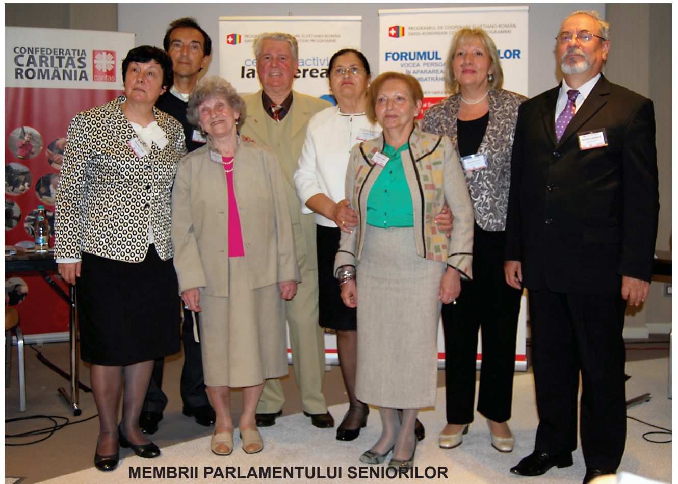
MEMBRII PARLAMENTULUI SENIORILOR

Pe 25 aprilie 2017 a avut loc cel mai important eveniment dedicat promovării drepturilor persoanelor vârstnice din România. Organizat de Confederația Caritas România, împreună cu Asociația C.A.R.P. „OMENIA” București, Forumul Seniorilor a fost conceput ca un spațiu de comunicare între decidenții politici și reprezentanții seniori ai Parlamentului Seniorilor. Cei 9 membri ai acestui for au prezentat în cadrul evenimentului un document de poziție ce cuprinde recomandări pentru crearea unui cadru legislativ favorabil unei îmbătrâniri demne și active.