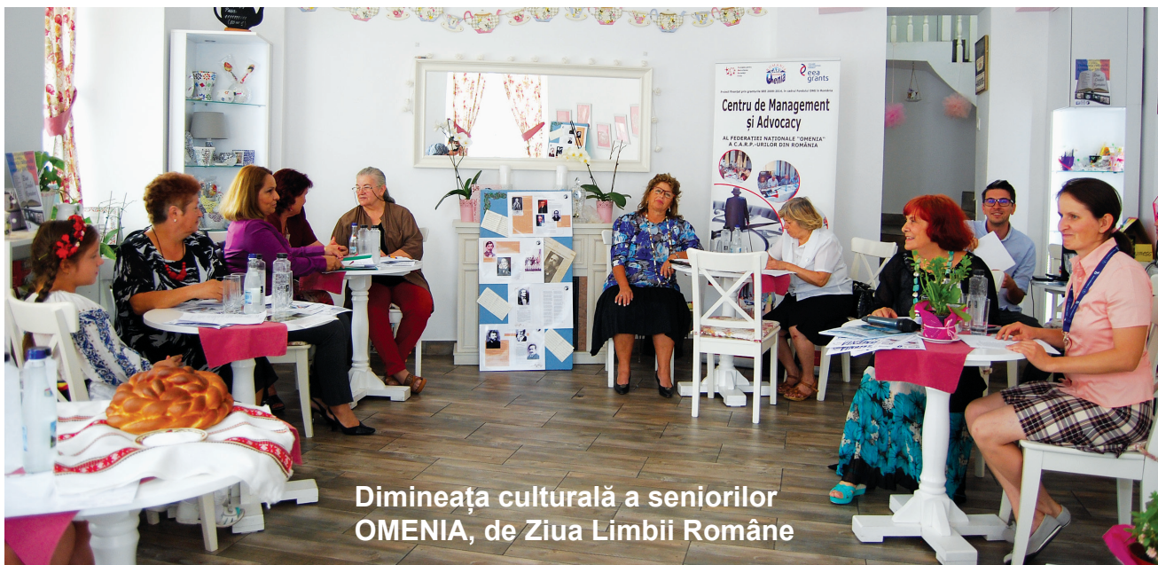
Dimineața culturală a seniorilor OMENIA, de Ziua Limbii Române