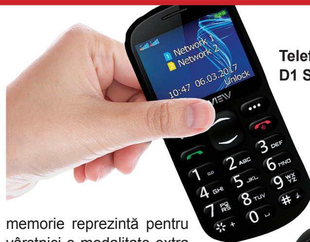
Telefon Allview D1 Senior

Nevoile care apar la vârsta a treia necesită soluții specifice, cu un grad de inovație ridicat, care se bazează pe noi tehnologii. Soluții precum teleasistența care ajută vârstnicii să trăiască independent mai mult timp, telefoane adaptate pentru a ajuta utilizatorii cu probleme de vedere sau auz, ATM-uri biometrice care utilizează amprenta digitală în locul codului PIN pentru a-i proteja pe cei cu pierderi de