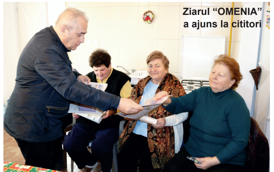
Ziarul "OMENIA" a ajuns la cititori