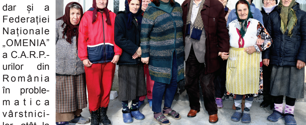
Comuna Ghimpați, sat Naipu

dar și a Federației Naționale „OMENIA” a C.A.R.P.-urilor din România în problema vârstnicilor, atât la nivel național, în calitate de reprezentant al societății civile la Consiliul Economic și Social, dar și ca reprezentant al vârstnicilor din România la Platforma Europeană AGE, organizație ce