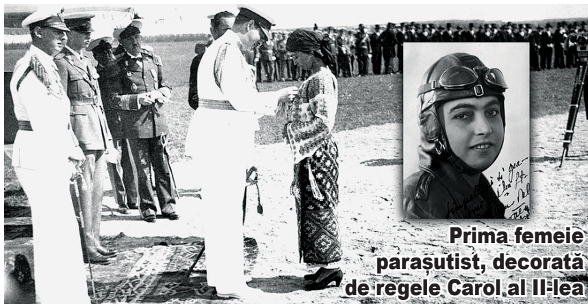
Prima femeie parașutist, decorată de regele Carol al II-lea