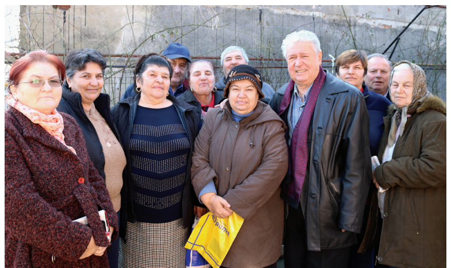
Comuna 1 Decembrie