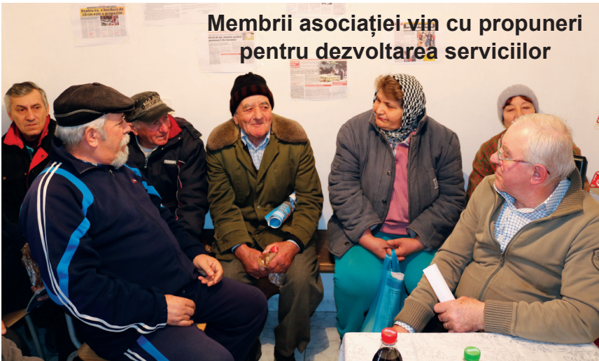
Membrii asociației vin cu propuneri pentru dezvoltarea serviciilor