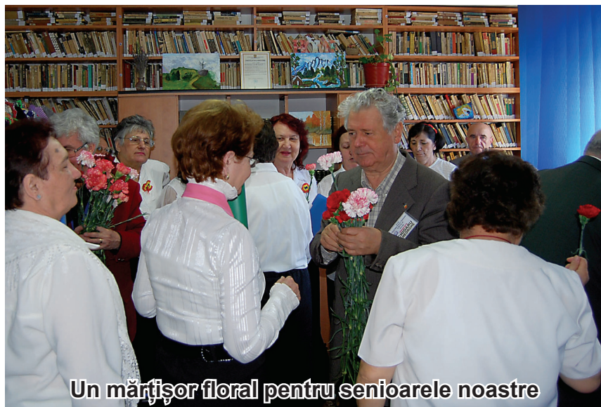
Un măștișor floral pentru senioarele noastre

Calendarul cerne timpul fără odihnă și după o iarnă promisă foarte grea, dar care nu s-a îndurat să ne chinuie prea mult cu geruri și zăpezi, a sosit primăvara lui 2018. Bun venit, renaștere a naturii și a vieții, cu bucuria darurilor tale de zile calde și măștișoare, ghiocei, viorele, zăpezi ale babelor și mieilor, costuri mai mici la întreținere, cu bogăția de verde din piețe... Bun venit cer senin și parcuri înflorite, unde ne putem plimba nepoții fără grija unei răceli urâte și unde putem scăpa de tristețea nopților nesfârșite de iarnă, când amintirea timpului care a trecut ne întrista cu chiar faptul că acele zile