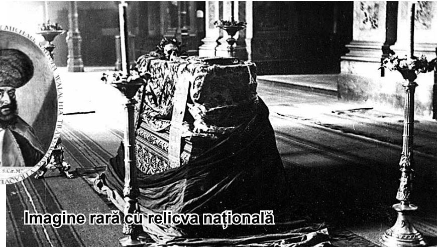
Imagine rară cu relicva națională

Din păcate, nu avea să-și găsească acolo odihna veșnică. Nu este întâmplător și nici coincidență că peste secole, în focul primului război mondial, la inițiativa lui Nicolae Iorga, pentru a nu