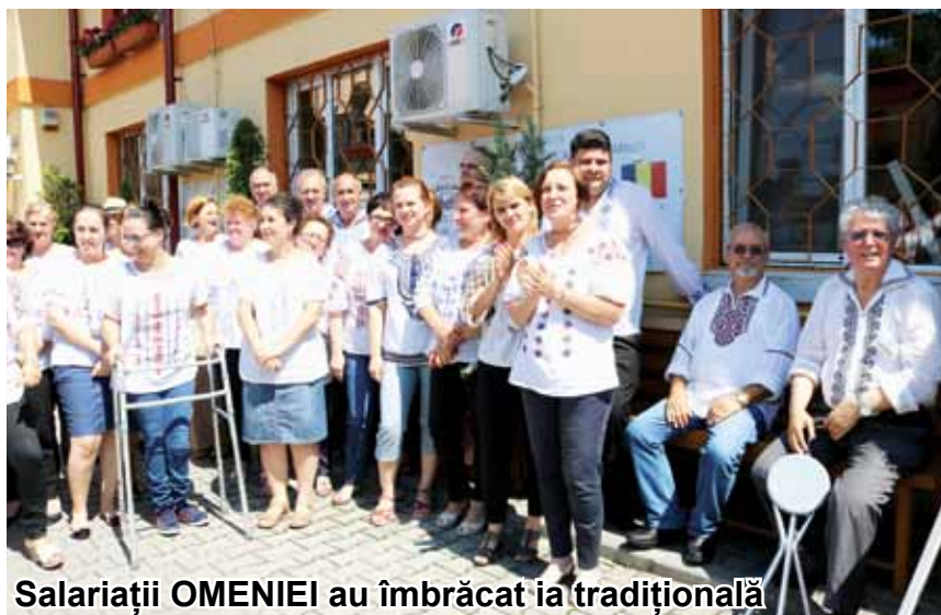
Salariații OMENIEI au îmbrăcat ia tradițională

de bumbac, de in sau de borangic și care se distinge, în funcție de regiune, atât prin motive, cât și prin tehnicile de decorare, transmise de la o generație la alta, fapt care a conservat tradiția, bunul gust și unicitatea de la o generație la alta. Croiul iei, simplu, a fost