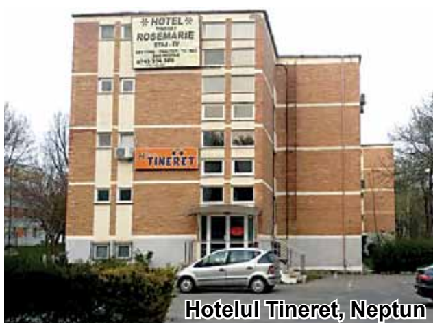
Hotelul Tineret, Neptun

Vă plac drumețiile și călătoriile, vreți să uitați pentru o clipă de sufocantul oraș și mo-