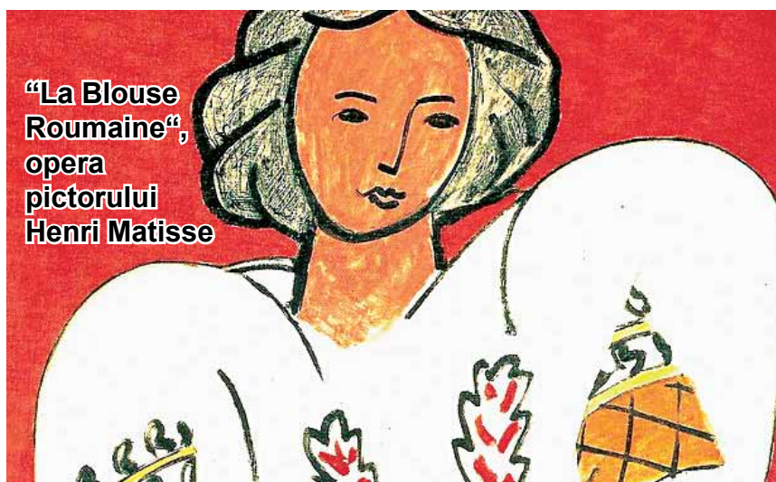
„La Blouse Roumaine”, opera pictorului Henri Matisse

Anul acesta, în întreaga țară sunt organizate expoziții și târguri tradiționale pentru una dintre cele mai importante moșteniri naționale și culturale ale României. Și, la nivel internațional, ia românească va fi sărbătorită în mai multe orașe, între care Chișinău, Berlin, Budapesta, Londra, Madrid, Paris, Roma, Washington ș.a. De asemenea, multe inițiative aparțin ONG-urilor, printre care și Asociația C.A.R.P. „Omenia” București, care cinstește acest simbol tradițional, incluzându-l într-un demers mai amplu dedicat centenarului Marii Uniri. Ia este bluza femeiască, confecționată din pânză albă