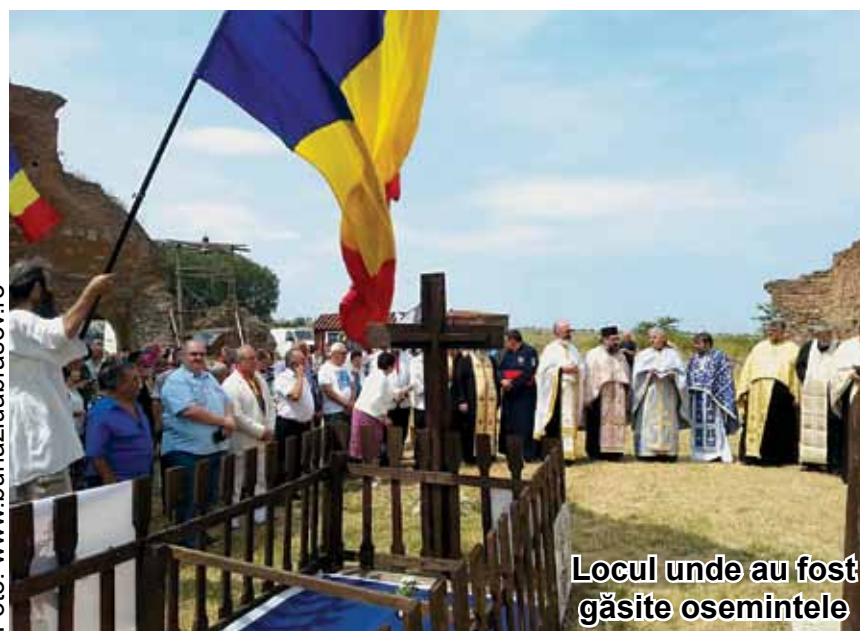
Locul unde au fost găsite osemintele

ani Mihai Viteazul cădea răpus pe Câmpia Turzii, Asociația C.A.R.P. „OMENIA” București, va participa prin reprezentanții săi, la mănăstirea Plăviceni din Județul