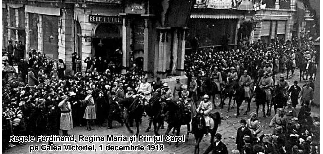
Regele Ferdinand, Regina Maria și Prințul Carol pe Calea Victoriei, 1 decembrie 1918

până la marea sărbătoare din 1 decembrie am decis să purtăm această minunat veșmânt strămoșesc. Sunt gesturi normale cred eu, deși am întâlnit persoane pentru care temele și simbolurile naționale nu reprezintă mare lucru, pentru care arborarea tricolorului este o chestiune depășită și