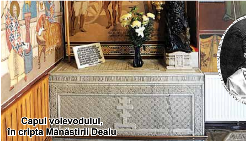
Capul voievodului, în cripta Mănăstirii Dealu

Anul centenarului este, pe lângă toate festivitățile, activitățile și comemorările în plină desfășurare și un bun prilej de a dezvălui cititorilor aspecte inedite și puțin cunoscute care sunt legate în mod direct de acest moment. Mai precis, povestea capului marelui voievod și întregitor de țară, Mihai Viteazul, a cărui odisee și zbcium prin istorie își are apogeul în evenimentele premergătoare Marii Unirii din 1918, dar și imediat după. Astfel, după cum se