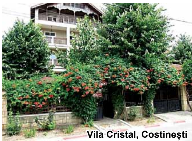
Vila Cristal, Costinești