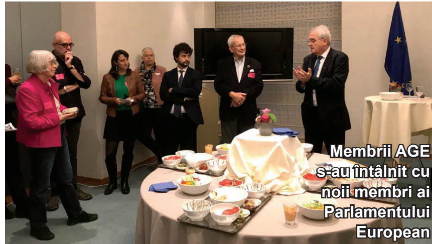
Membrii AGE s-au întâlnit cu noii membri ai Parlamentului European

pensii, atât pentru femei, cât și pentru bărbați; protejarea dreptului de a trăi și îmbătrâni în mod demn, printr-o sănătate adecvată centrată pe persoană și o îngrijire de lungă durată, accesibilă tuturor; asigurarea unei vieți sănătoase și