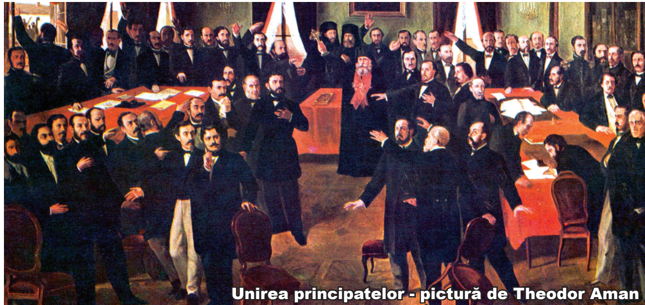
Unirea principatelor - pictură de Theodor Aman

Luna aceasta se împlinesc 161 de ani de la Mica Unire, împlinită la voința populară care a hotărât să aibă un singur domnitor: Alexandru Ioan Cuza ales domn al moldovenilor la 5 ianuarie 1859 și la 24 ianuarie 1859 de către populația cu drept de vot din Țara Românească, efectuându-se astfel, prin vot popular la 24 ianuarie 1859 Unirea celor două principate sub conducerea unui singur domnitor. Acest fapt este considerat a fi un prim pas