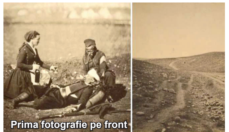
Prima fotografie pe front

erau camerele foto de pe acea vreme și cum sunt acum aparatele foto, tehnologia făcând un salt important. Mărci cum ar fi Kodak, Cannon și atâtea altele au dezvoltat piața fotografiei obținând un astfel de salt, iar capacitățile militare au adus un nou plus camerelor de supraveghere, deoarece au devenit mult mai ușoare și mai ușor de utilizat.