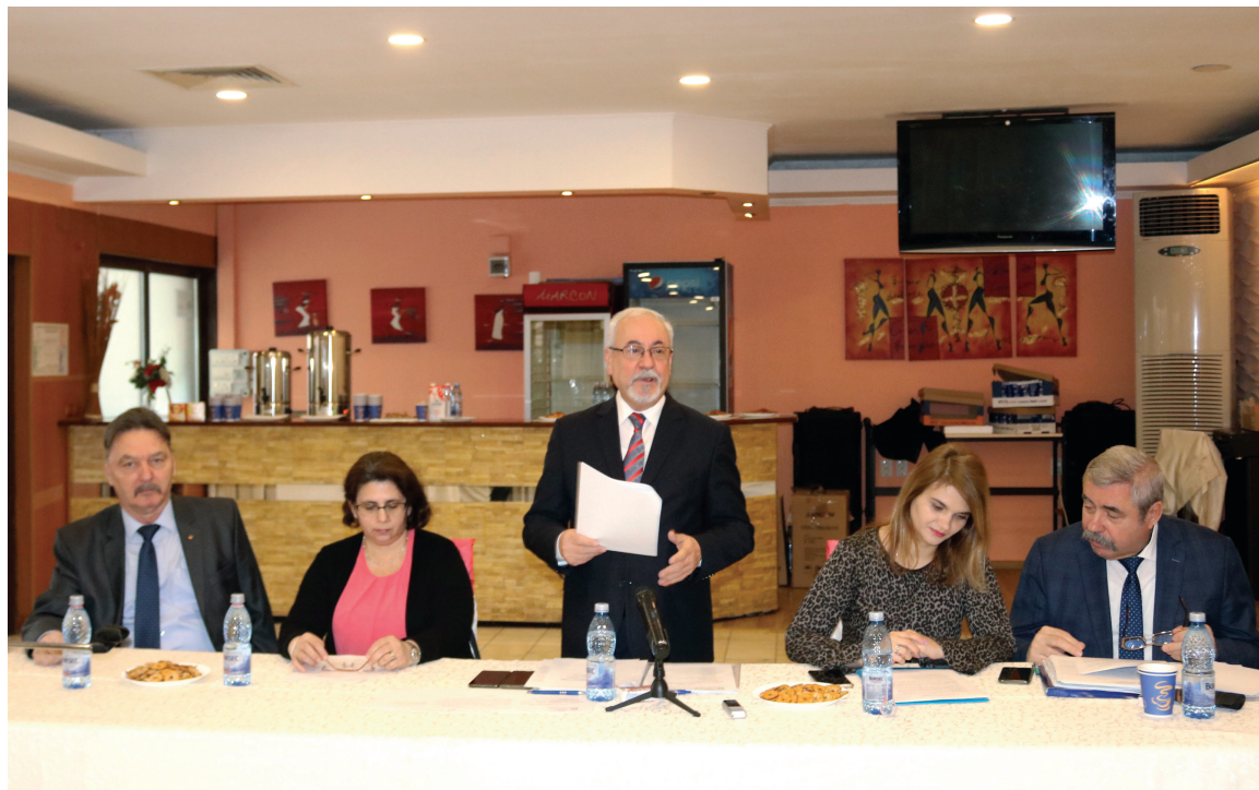
Asociația C.A.R.P. „OMENIA” București, la ora bilanțului