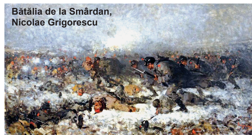
Bătălia de la Smârdan, Nicolae Grigorescu

Ziua de 9 mai are pentru poporul român o multiplă semnificație. Pe lângă Ziua Independenței proclamată în 1877 și Ziua Victoriei Coaliției Națiunilor Unite în cel de-al Doilea Război Mondial sărbătorim și Ziua Europei. Astfel, data de 9 mai reprezintă un moment de adâncă reflecție și de aducere – aminte a faptelor și evenimentelor din istoria României. În contextul prefigurării conflictului din Balcani, România a semnat la 4 aprilie 1877 Convenția cu Rusia, prin care armatele acesteia erau lăsate să treacă pe teritoriul României,