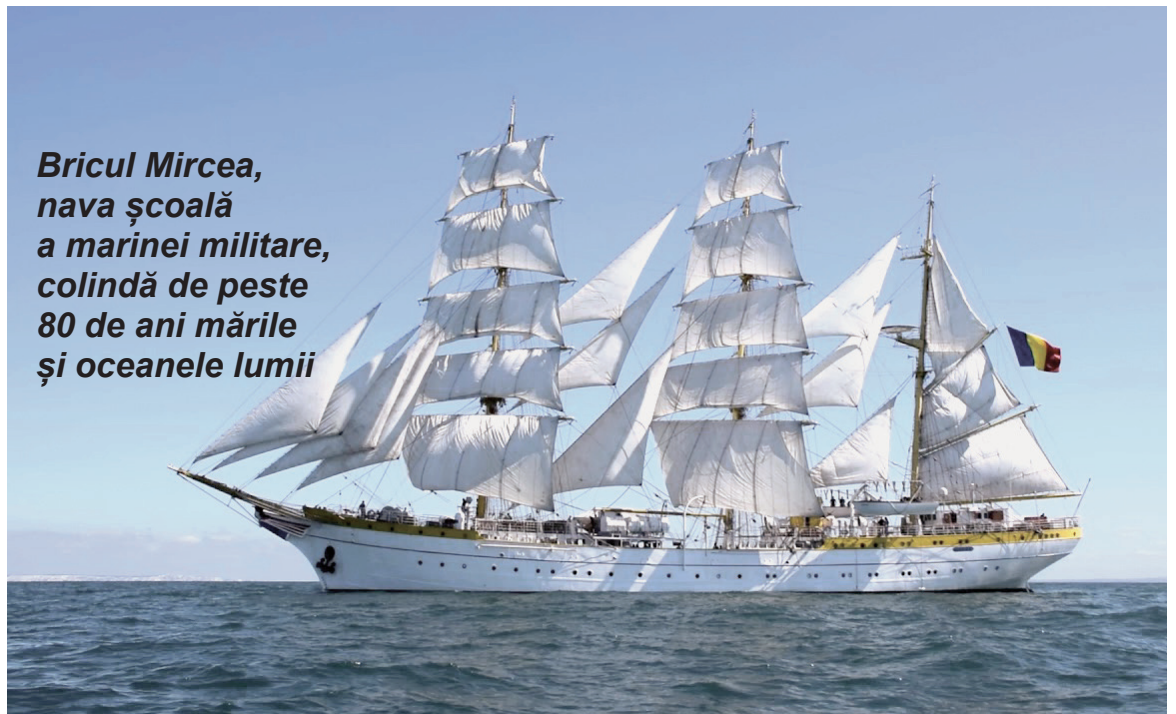
Bricul Mircea, nava școală a marinei militare, colindă de peste 80 de ani mărele și oceanele lumii

De peste un secol, cel mai mare spectacol naval românesc s-a evidențiat prin programul său deosebit, precum ceremonialul militar al întâmpinării oficialităților, arborarea pavilionului și a marului pavoaz, în acordurile Imnului național și pe fundalul celor 21 salve de